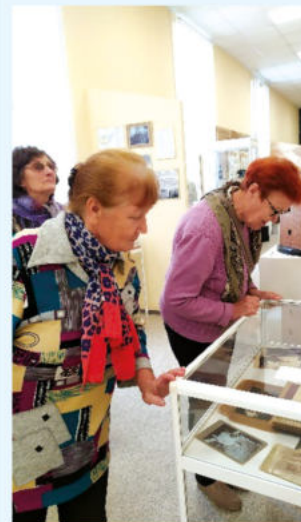
Гости завода — на экскурсии в корпоративном музее

После экскурсии группа перешла в актовый зал для просмотра видеофильма о производственном процессе, подразделениях, цехах Березниковского содового завода, а также и работе сырьевой площадки — карьера известняков. Обсудить увиденное ветераны смогли в заводской столовой, где их угостили вкусным обедом.