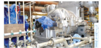
Работы по монтажу винтового компрессора в машинном отделении цеха кальцинированной соды №1 практически завершены

Окончание работ, пуско-наладка оборудования и гидравлические испытания запланированы на октябрь 2022 года. Затем новый винтовой компрессор будет введён в эксплуатацию.