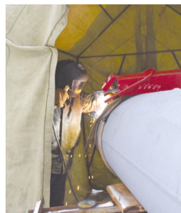
Работа по монтажу нового паропровода на основной производственной площадке кипит