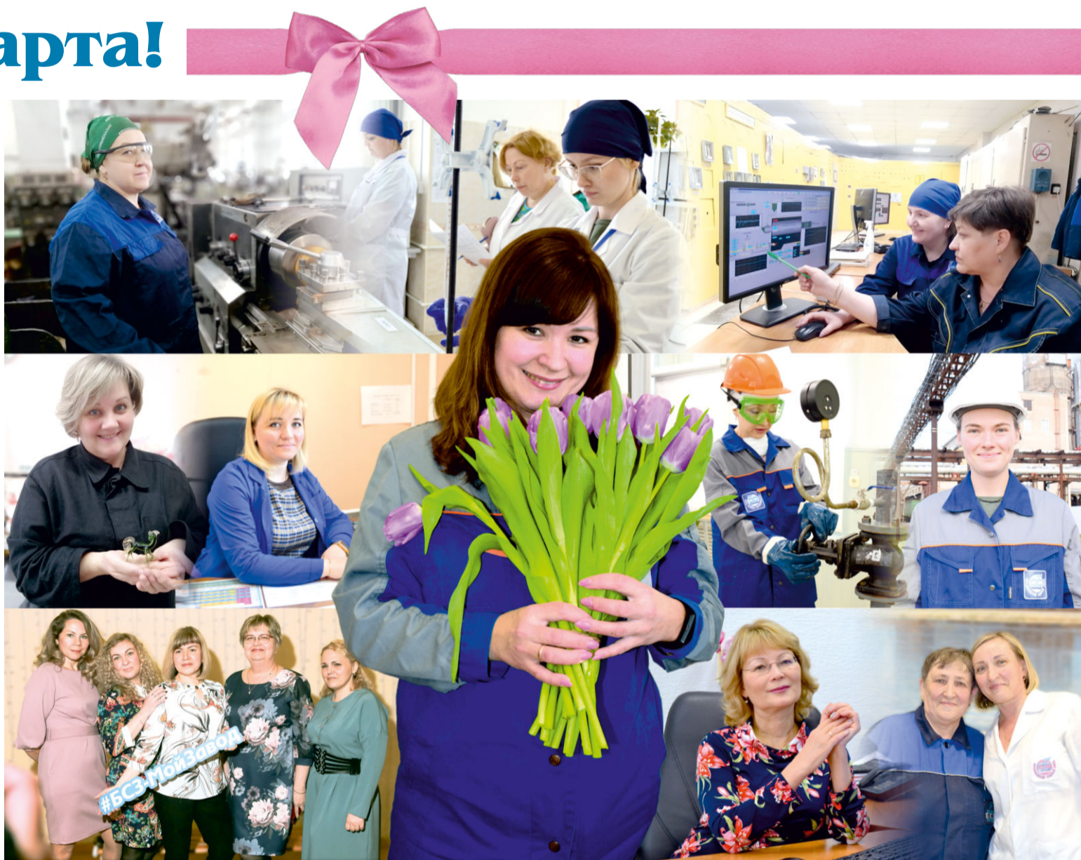
На Березниковском содовом заводе трудятся 938 женщин. 660 из них – рабочие, 200 – специалисты, 78 – руководители. Все такие разные, но объединяет их одно – любовь к своей профессии. На этих снимках – лишь малая часть героинь, о которых мы в разные годы рассказывали на страницах «Содовика»

Милые женщины, пусть нынешняя весна принесёт вам только счастливые моменты! С праздником!