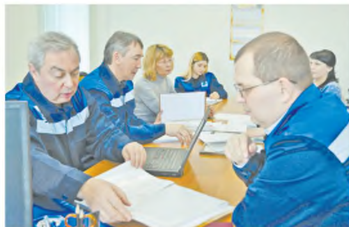
Аудит в цехе извести

Аудиторы с дотошностью проверяли документацию, выполнение регламентированных работ, прошли по всем технологическим цепочкам основных цехов и многих вспомогательных подразделений.