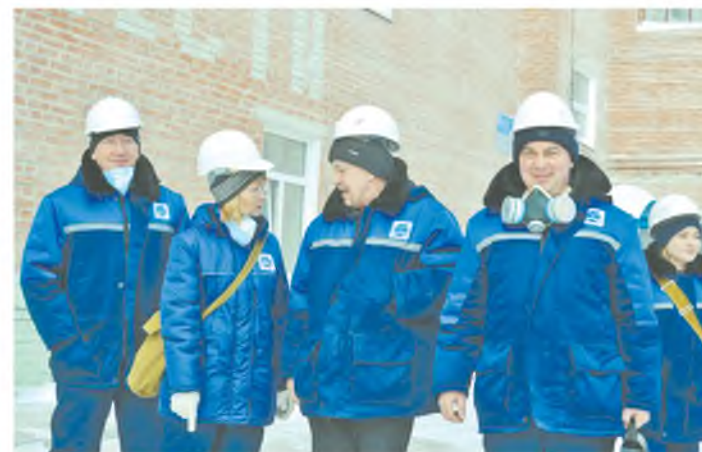
Из кабинета – в производство цеха

По результатам внешнего аудита сертификационный орган принял решение о соответствии наших систем менеджмента требованиям ISO 9001:20015, ISO 14001:2015 и OHSAS 18001:2007.